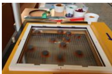
☞ Souprava termika